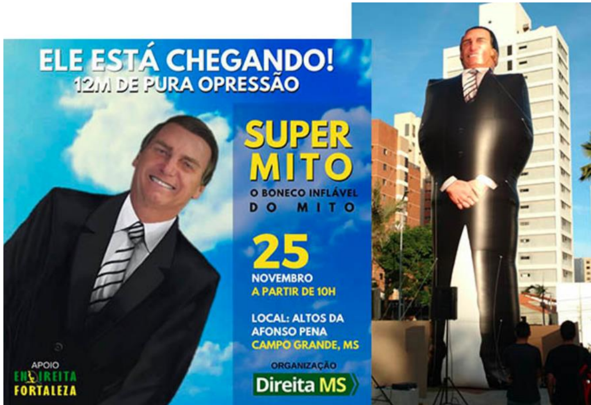
FIGURA 5 - Boneco Inflável de Jair Bolsonaro