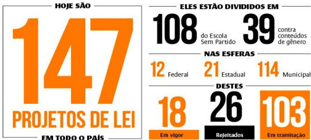
FIGURA 9 - Número de Projetos de Lei em todo o país