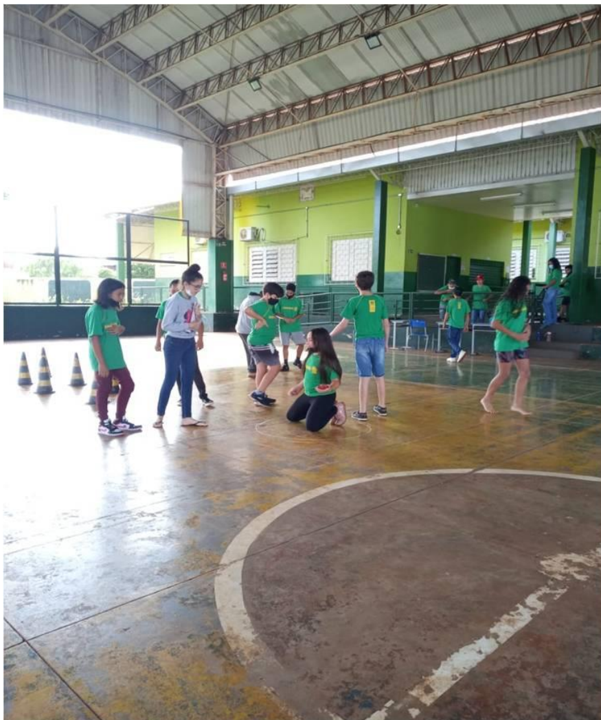
Imagem 8: Atividade meu Circuito Divertido