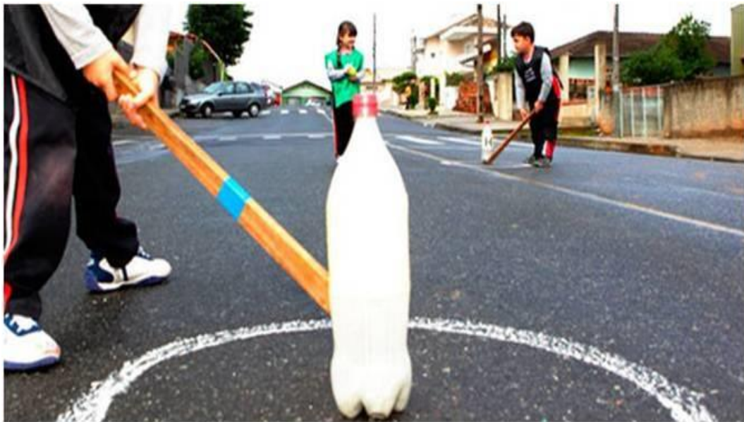
Imagem 5: Bets na Rua

Observando essa imagem 4, vejo o retorno/retornar da simplicidade e o buscar momentos que possam deixar o aluno feliz e emocionado. E não concordo com o ponto de vista de ninguém, em explicar que nesse momento de jogar bola de gude não estarei desenvolvendo cultura e conhecimento a esse corpo/aluno. Posso citar alguns exemplos como: coordenação motora fina, concentração, raciocínio, estímulo a criatividade, conceitos de estrutura espacial, técnica para realizar movimentos de arremesso, ajuda na socialização, que a prática auxilia na psicomotricidade, entre outros, em um simples jogo de bola de gude tudo isso pode ser evidenciado. Com isso, irei desenvolver as habilidades do aluno sem forçá-lo a praticar um esporte para completar o referencial curricular (futsal, handebol, basquetebol e voleibol), pois, todos são importantíssimos.