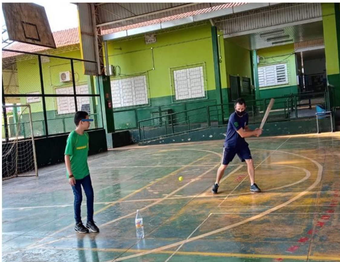
Imagem 15: Jogo do Taco e ou Betis 68