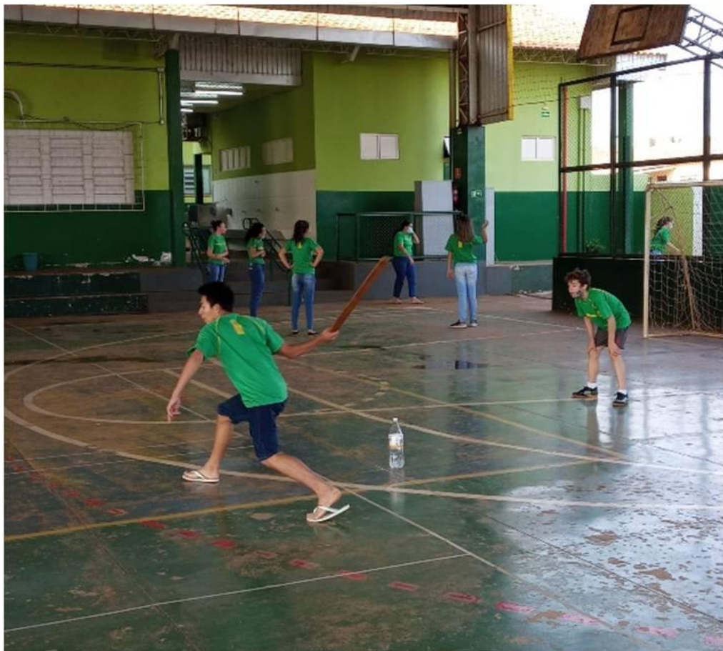
Imagem 16: Jogo do Taco e ou Betis