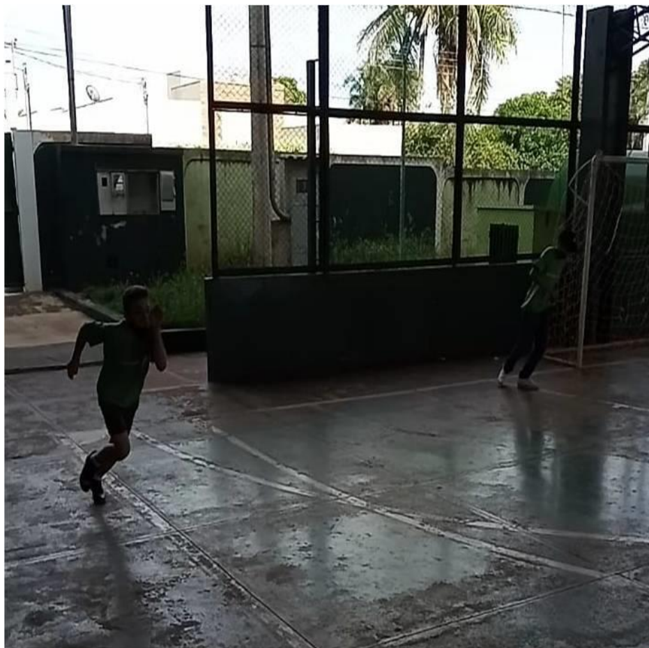
Imagem 10: Atividade Pacman Humano