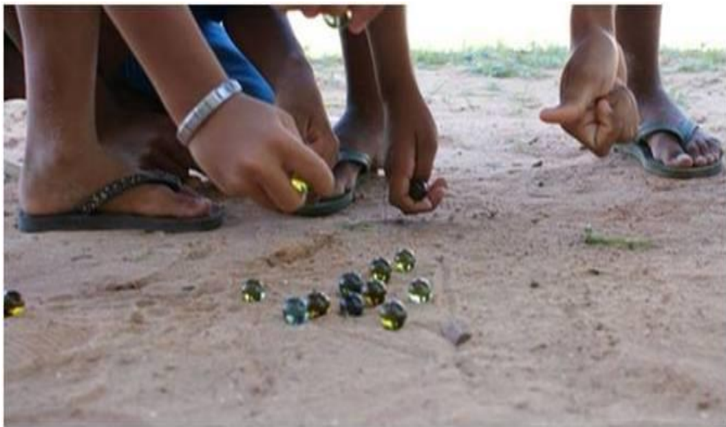
Imagem 4: Bolinhas de Gude

ou jogar bola de gude. Mas me recordo agora que essas memórias, muitas vezes, das brincadeiras e práticas culturais (esportivas) da minha infância tão feliz nunca, ou quase nunca, estiveram compondo os conteúdos das escolas em que estudei. Será porque eram práticas e brincadeiras de uma, como muitas outras, infâncias pobres dos diferentes lugares brasileiros? Ou será que é porque percebemos, agora, que a escola optou, por uma questão de políticas de Estados, por manter fora das escolas exatamente aquilo que ela insiste ainda hoje afirmar privilegiar: brasileiros que precisam da escola como espaço de Educação. Será que as escolas são mesmo espaços de produções de conhecimentos no plural?