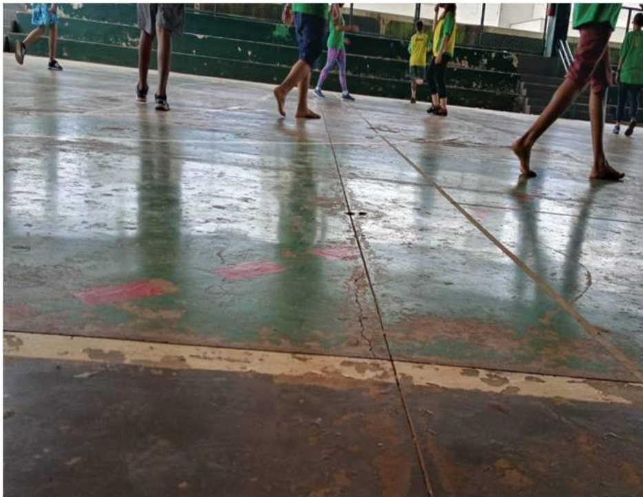
Imagem 14: Se Autorreconhecer

Dessa forma, observo que alunos aprendem através desta proposta, pois conseguem verdadeiramente falar, ensinar e aprender através de seus corpos/alunos, promovendo o reconhecimento a partir de si próprio, do corpo outro e da contextualização propriamente em seu espaço-corpóreo. Esses sujeitos-corpos-lugares não são reconhecidos pelas instituições escolares e pela ciência moderna. Com isso, são gerados conhecimentos e culturas, a partir de uma construção epistêmica que parte de suas experevivências e suas narrativas, que nem sempre é manifestado por esse corpo/aluno em suas relações com esses lugares . É necessário que este corpo/aluno tenha seu lugar de fala, (re)existindo a toda opressão. Dessa forma, todos esses corpos chegam ao seu autorreconhecimento, da autorrepresentação de identidade e para ser respeitado a/ou respeito por si próprio em relação ao outro, por dentro ou fora dos entre muros da escola e ou sala de aula.