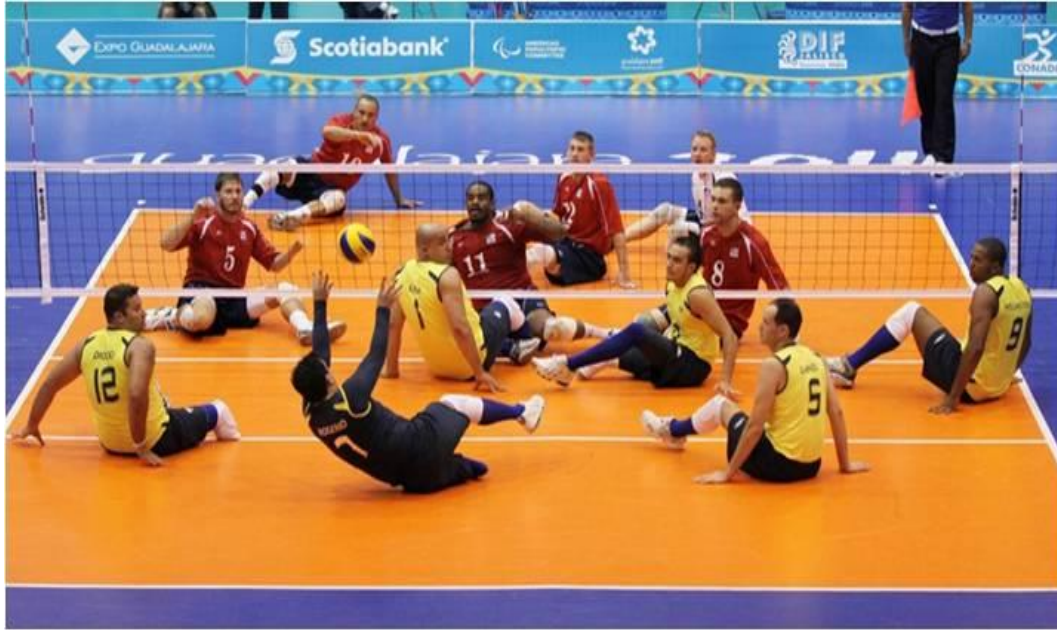
Imagem 3: Voleibol Adaptado