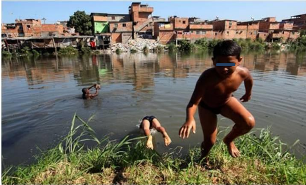
Imagem 6: Lazer na Favela