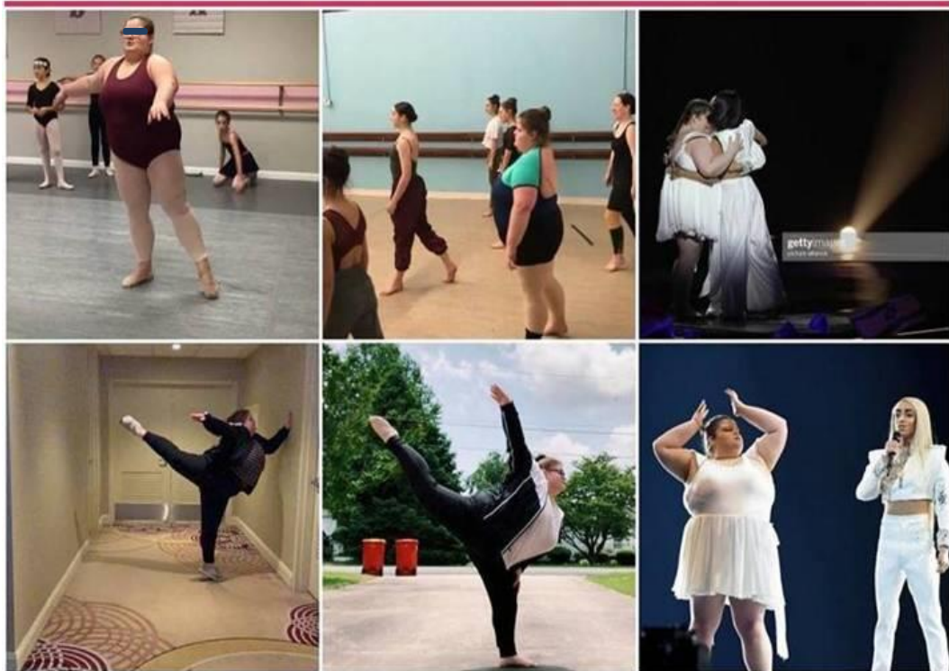
Imagem 1: Esqueça o Padrão. Faça o que te faz feliz.

vai estar subjugado. Da mesma maneira, que questiono a necessidade de aprender somente as modalidades de voleibol, basquetebol, handebol e futsal, como únicas práticas de Educação Física, e os corpos/alunos capazes de perceberem e desenvolver qualquer prática esportiva e jogos. Por exemplo, o balé e sua prática impõem os princípios de leveza, postura reta, harmonia, padrão corpóreo e entre outras, com suas características únicas em seu desenvolvimento: