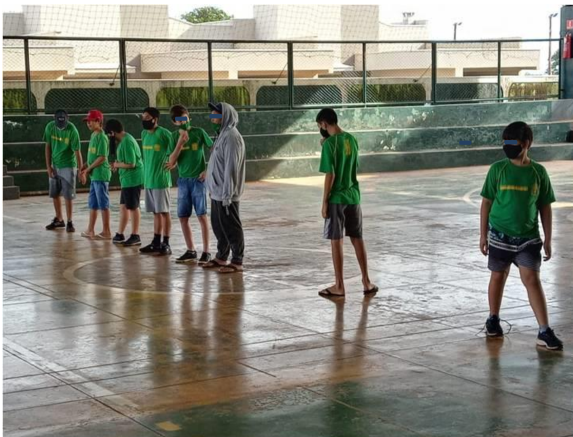
Imagem 13: Atividade Dono da Rua

Nessa atividade quem é o Dono da Rua fica no meio da quadra, não podendo deixar passar quem irá ficar no outro lado, se o dono da rua encostar em alguém, esse mesmo ajudará a pegar o restante.