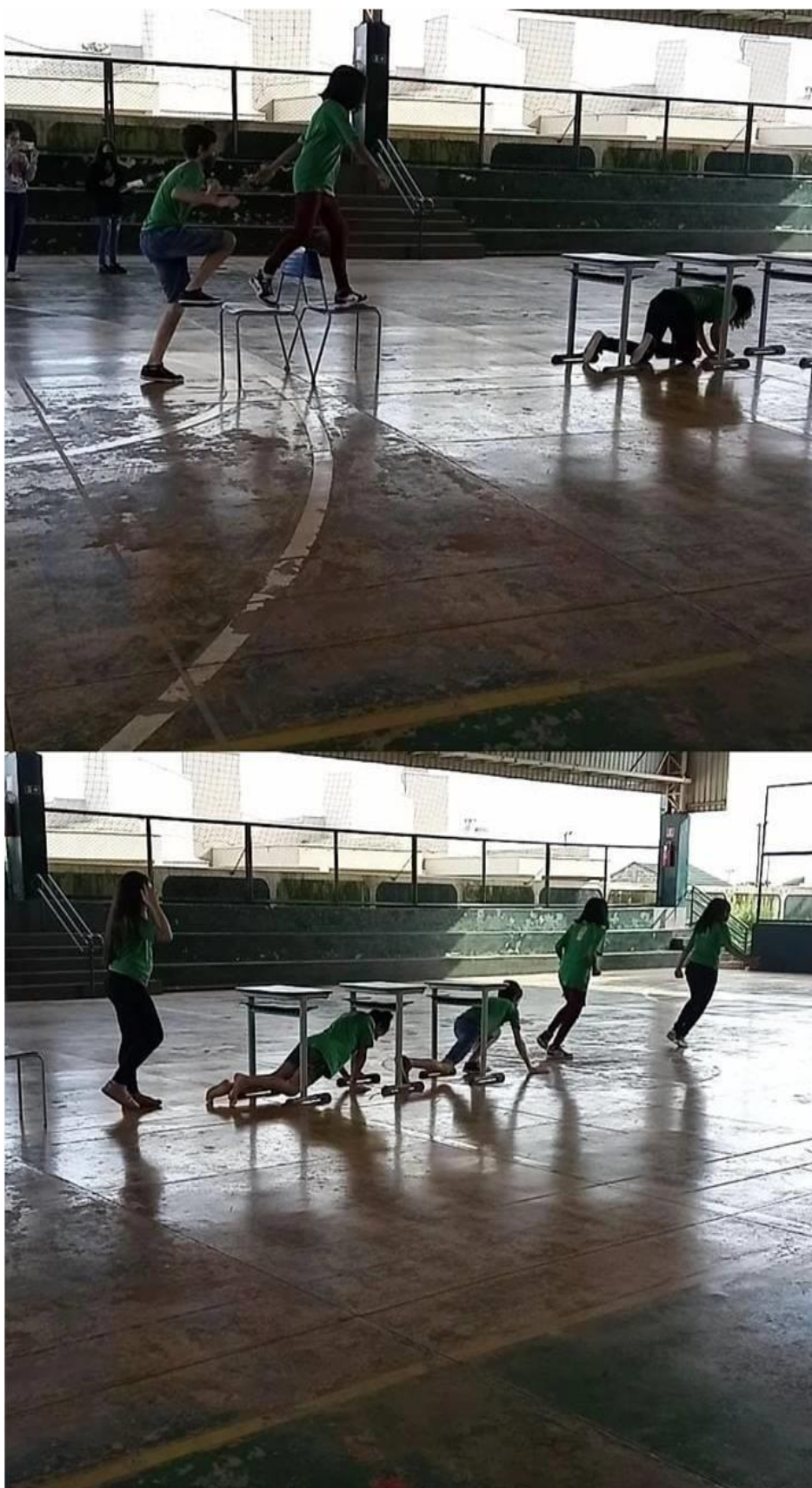
Imagem 9: Atividade meu Circuito Divertido