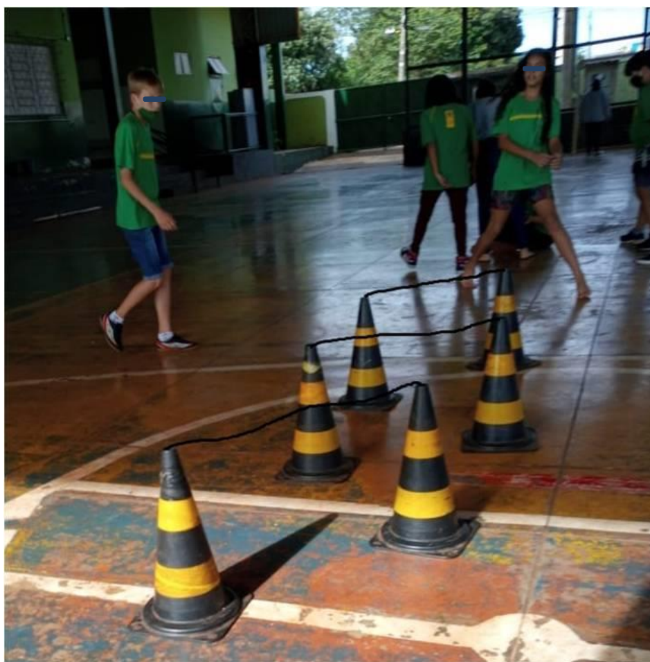
Imagem 12: Atividade de Corrida Zigue-Zague com tempo

Isso pode ser feito mesmo sem qualquer equipamento, colocando-se os dedos indicador e médio na lateral do pescoço para sentir o pulso, verificando quantas pulsações ocorrem em um minuto. O mesmo resultado é encontrado ao se contar as batidas por 15 segundos, depois multiplicando o resultado por 4.