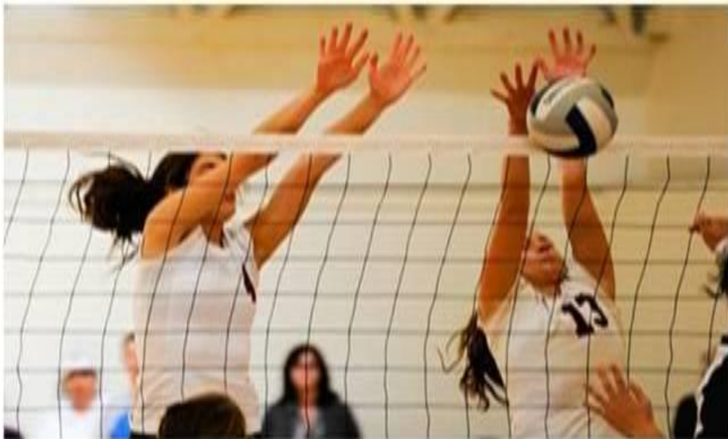
Imagem 2: Fundamentos da Modalidade do Voleibol

Na escola, deparáramos com docentes da área de Educação Física adotando a prática de modalidades nos moldes tecnicistas, o que remete a cenas com corpos semelhantes a robôs, buscando aprimorar técnicas para obtenção de uma política de corpo. Busca-se o corpo atleta, basicamente reproduzindo/repetindo seus movimentos para uma geopolítica de interesses, pensando nos corpos exclusivamente, para representar suas cidades, estados, países em modalidades de competições esportivas da razão capitalista. Na imagem 2, por exemplo, observamos corpos somente reproduzindo movimentos para a produção de um corpo atleta para competição.