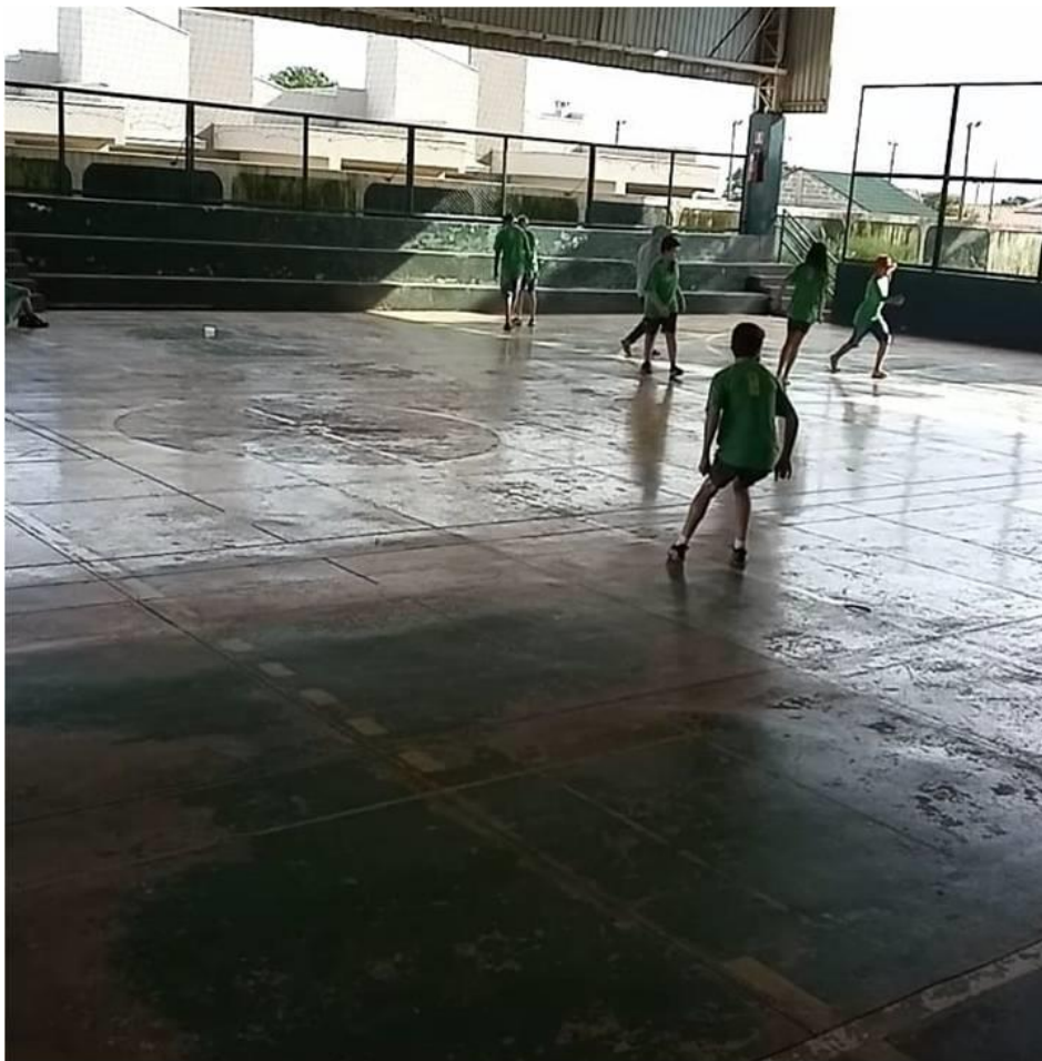
Imagem 11: Atividade Pacman Humano