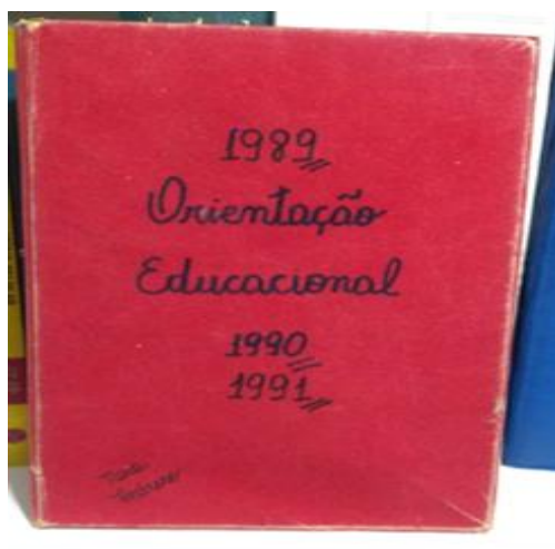
Figura 1 - Caderno de anotações de sala da pedagogia da cp2 da escola central