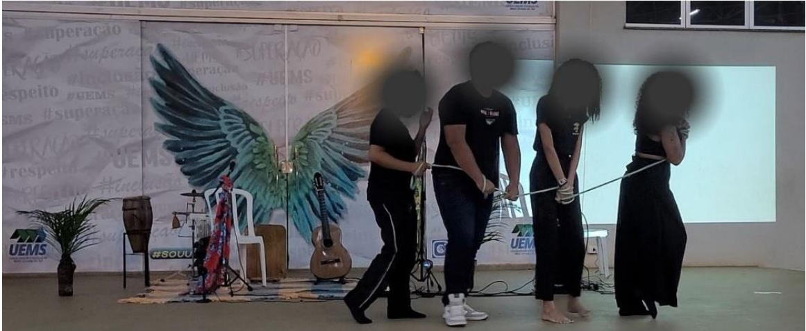
Figura 1 - 1o ato. Elza Soares: mulher, fome e povo negro