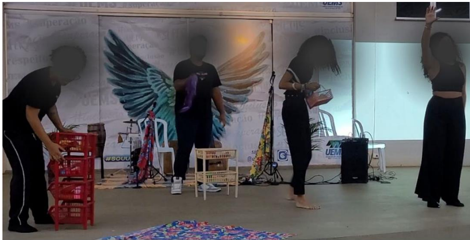
Figura 2 - 2o ato. Elza Soares: mulher, fome e povo negro

Os estudantes interpretaram muito bem em cena (Figura 2) o que a música trata. Um povo excluído socialmente e que mesmo diante de todas as perversidades vividas na ordem social institucionalizada em que vivemos, não perde as esperanças de uma vida melhor. Isto pode ser percebido na segunda parte da letra da canção, em que é expressado o anseio não pelas fortunas da classe mais abastada às custas de muito suor de vidas alheias, mas sim, da dignidade que deveria ser assegurada para todo sujeito pelo Estado.