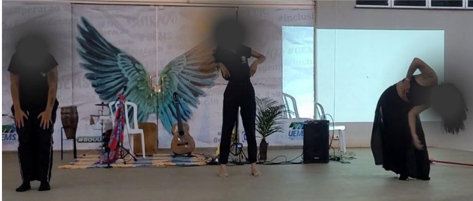
Figura 3 - 4o ato. Elza Soares: mulher, fome e povo negro

de sua vida, em que sua principal arma política sempre foi a voz, assim também se traduz as lutas que os pobres e oprimidos travam cotidianamente.