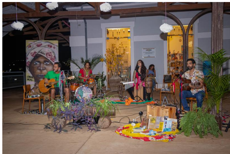
Figura 9 - Projeto UmoJa - 36ª Feira Afro do MS

No dia 11 de maio de 2024 aconteceu a 36ª Feira Afro do MS 60 , importante evento cultural do estado que tem como finalidade promover o empreendedorismo negro, produtos e serviços relacionados à valorização da cultura e identidade Afro. Na referida feira cultural, o Projeto UmoJa realizou uma intervenção artística (Figura 9), apresentando cinco canções de Chico César, investigadas neste trabalho: Dança , Pedrada , Mama África , Negão e Respeitem meus cabelos, brancos . Com falas objetivas, interseccionando poesias, dança e literatura e um cenário envolvendo uma atmosfera que remete à origens africanas, convidou o público ali presente para a reflexão fazendo crítica às diferentes formas de opressão que as populações marginalizadas sofrem, sobretudo, a população negra.