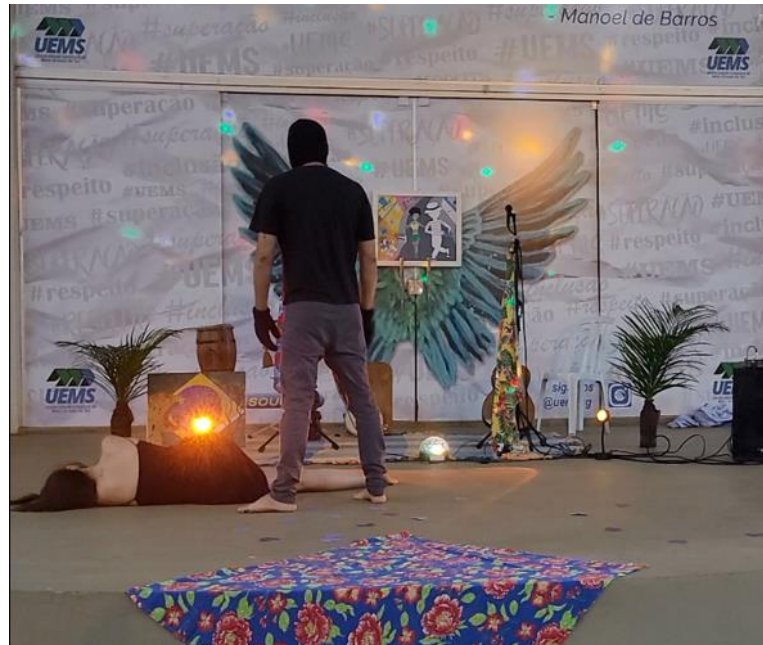
Figura 4 - 2o ato. Apresentação: Teatro com música