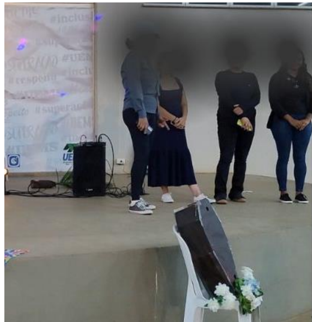
Figura 6 - Anjo Negro

Nesse sentido, o grupo de estudantes (Figura 6), inspirados nas discussões que tivemos em sala de aula acerca da utilização da arte crítica para promover debates importantes, sobretudo em instituições de ensino, propuseram reflexões das relações étnico raciais no âmbito subjetivo para pensarmos o quão perversas podem ser as violências provocadas pelo racismo.