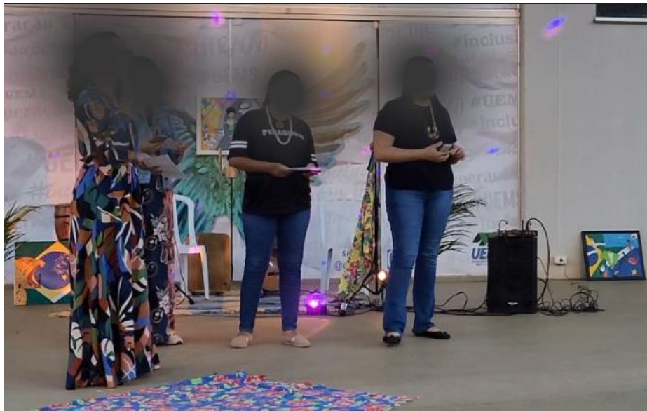
Figura 7 - Mulata Exportação

gênero e sexo que se interseccionam. Foram recitadas A Ilha , Poemeto de amor ao próximo , Aviso da lua que menstrua , Cor-respondência e Mulata exportação 56 , a qual damos destaque.