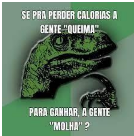
Figura 2 - Advice Animals