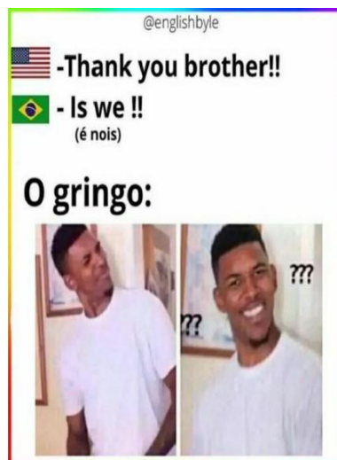
Figura 7- O cara confuso