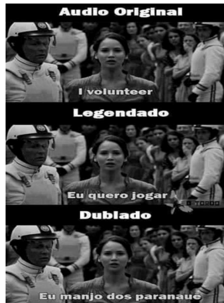
Figura 8 - "Eu me ofereço como Tributo