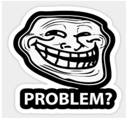
Figura 1- Troll Face