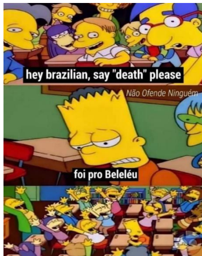
Figura 5- Diga a frase, Bart

A análise deste meme evidencia como o português coloquial se manifesta em práticas digitais, revelando que a língua não é homogênea, mas marcada por variações que refletem identidades sociais e culturais. Essa constatação confirma que o discurso, como aponta Orlandi (2001), é atravessado por ideologias e condições de produção que determinam os sentidos possíveis.