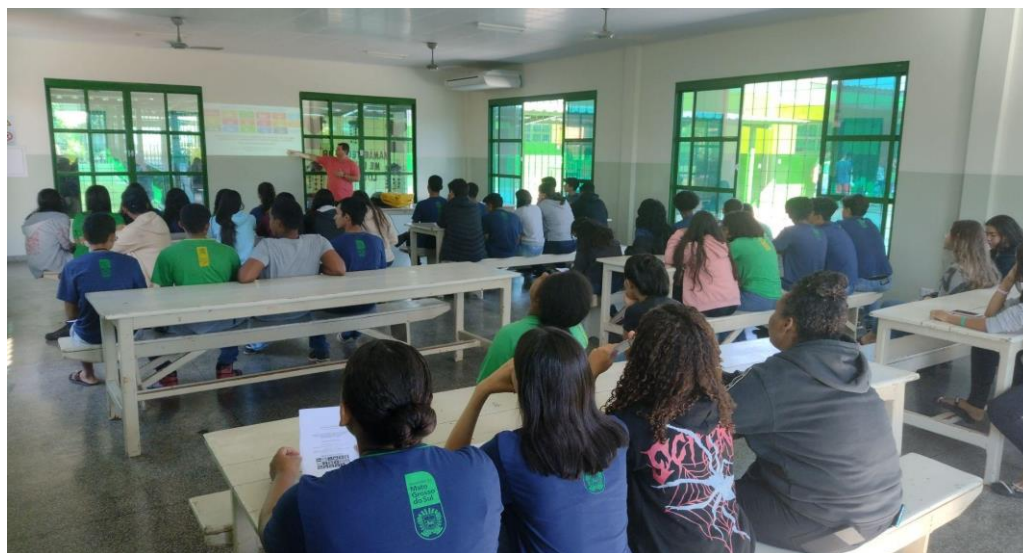
Imagem 9. Estudo dos ODS

Na imagem 9 e 10 é mostrado um dia de aula de sociologia no anfiteatro, seguido de produções de cartazes pelos estudantes. A cada discussão e estudo sobre os ODS, os estudantes são motivados a produzir algo, que pode ser na escrita, desenhos ou mesmo uma roda de conversa. Essas produções e o discurso de cada estudante são elementos que permitem uma avaliação do processo, daquilo que pretende atingir na pesquisa. É na análise dos conceitos trazidos em cartazes, textos e argumentos no discurso, que sinaliza até que ponto essa intervenção consegue fazer com que o estudante mude seu olhar, entendimento e participação nos processos sociais de forma que reflita em mudanças.