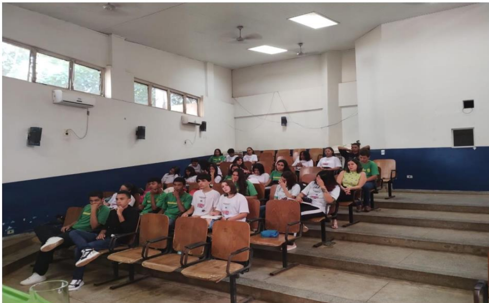
Imagem 3. Apresentação e discussão temática dos Objetivos do Desenvolvimento Sustentável do Milênio (ODS de 05 a 08), Local: UEMS.

ação atende o que a Unesco sugeriu como Objetivos de Aprendizagem Cognitiva, apresentada na tabela 1, página 60. Na sequência, outros professores debateram inicialmente outros objetivos com uma discussão com os estudantes sobre. Além disso, houve uma fala com os estudantes sobre questões indígenas e sobre direitos em geral da população. Objetivou-se nessa ação trazer elementos que as habilidades das ciências humanas trazem no currículo e também na aprendizagem cognitiva sugerida pela UNESCO. Esse primeiro momento do projeto visa essa apropriação conceitual, munir o estudante de conhecimentos e elementos que o capacite para entender o contexto dos ODS e sua dimensão.