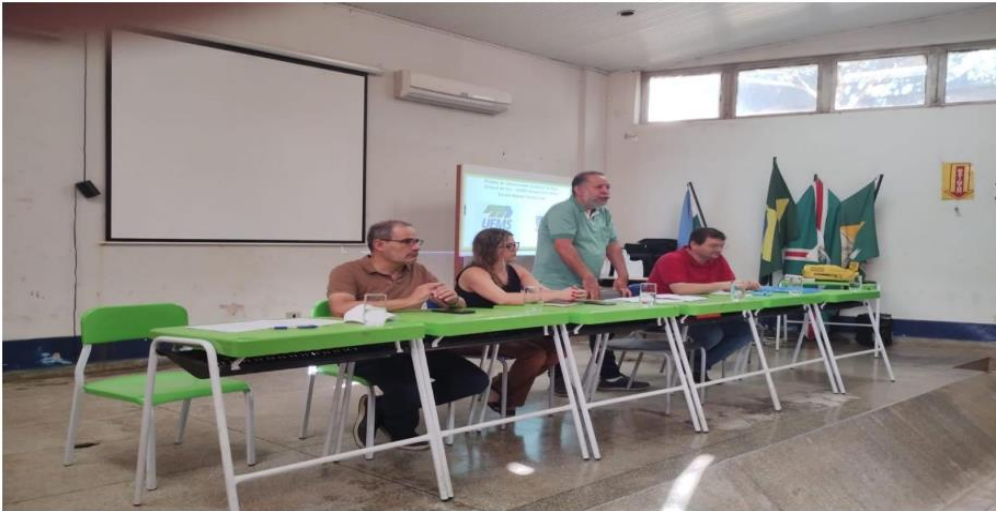
Imagem 1. Apresentação com docentes de universidade Estadual de Mato Grosso do Sul - UEMS