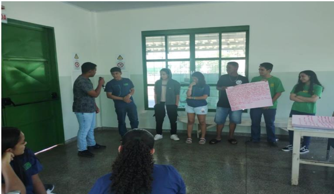
Imagem 5. Apresentação e discussão temática dos Objetivos do Desenvolvimento Sustentável do Milênio (ODS de 13 a 17), Local: UEMS e na Escola Manuel Garcia Leal.