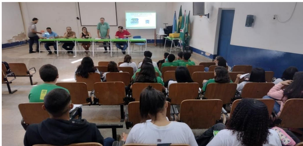
Imagem 2. Participação dos estudantes na apresentação dos objetivos